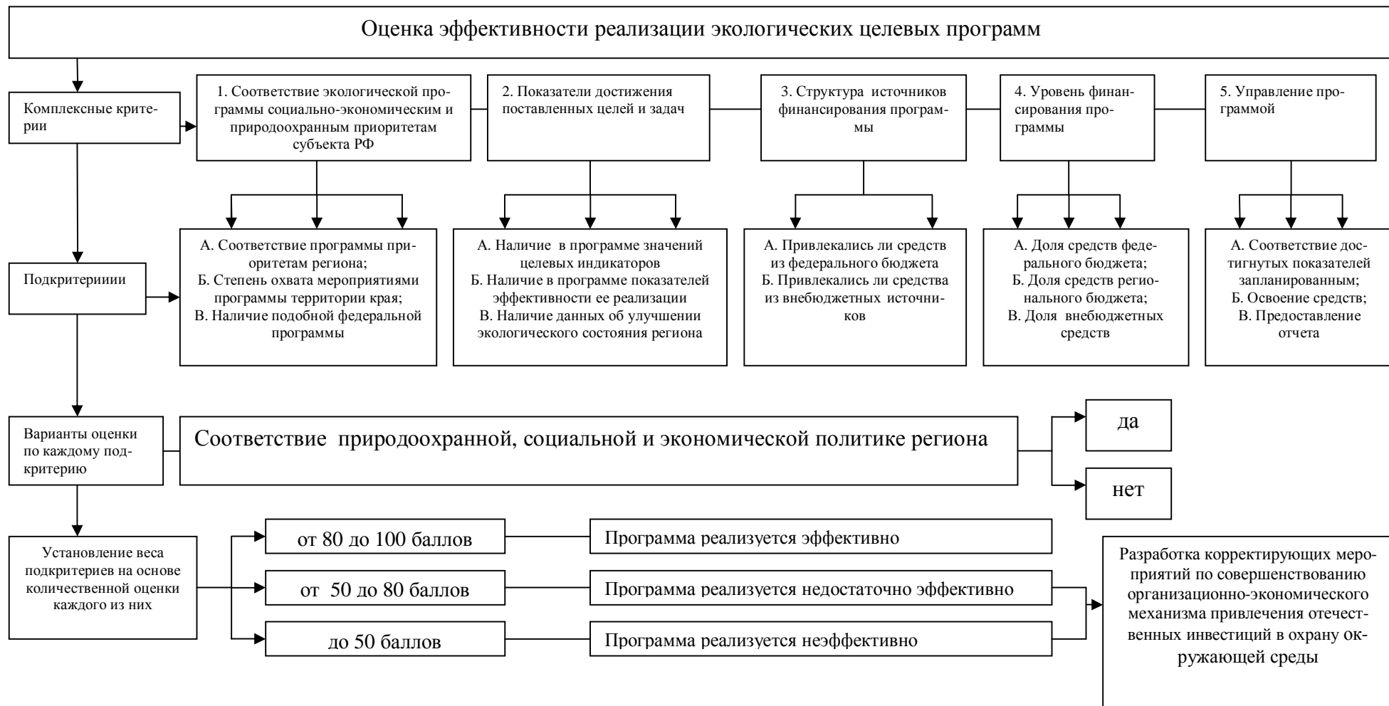
Рисунок 2 - Методика оценки эффективности реализации программ экологической направленности