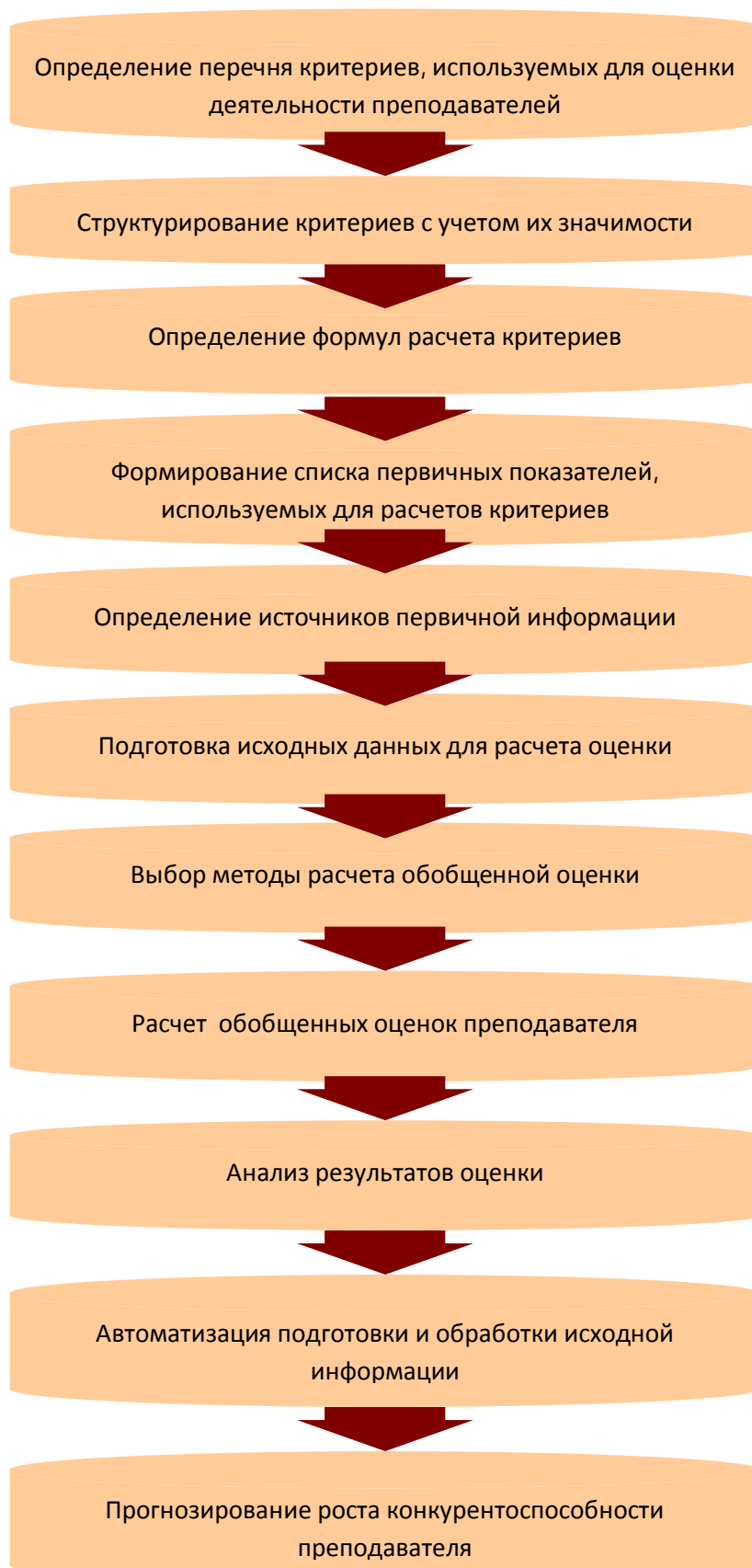
Рис.2 Этапы создания системы оценки профессионально-педагогической компетентности и конкурентоспособности преподавателя

Полученные в ходе исследования результаты, подтверждают