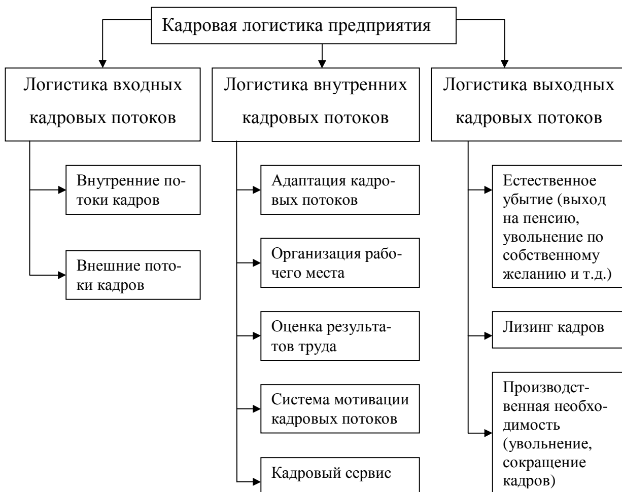
Рисунок - Структурная схема кадровой логистики предприятия

Логистика входных кадровых потоков. Источники, питающие фирму различными ресурсами (материальными, информационными, финансовыми), находятся в основном во внешней среде. Это положение относится и к источникам кадровых ресурсов. Основными внешними источниками входного потока персонала являются: учебные заведения, службы занятости (биржи труда); специализированные фирмы по найму персонала. Однако ресурсы внешней среды не безграничны, на них претендуют многие другие фирмы, это относится и к кадрам. Кроме того, фирма может не располагать возможностями или считать нецелесообразным предложить условия найма на том уровне, какой установился на рынке труда. Поэтому всегда есть опасность, что фирма не сможет получить работников извне.