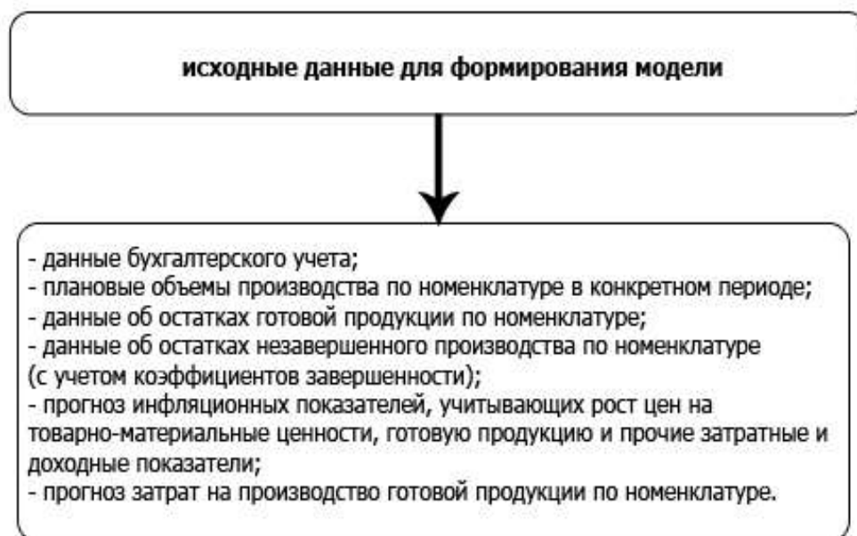
Рисунок 1 – Исходные данные для формирования модели

На рисунке 1 отражены исходные данные для формирования модели.