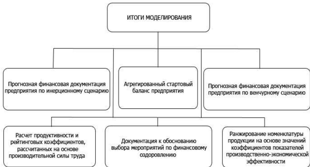
Рисунок 3 – Вариации итогов моделирования

На рисунке 3 схематично представлены вариации итогов моделирования.