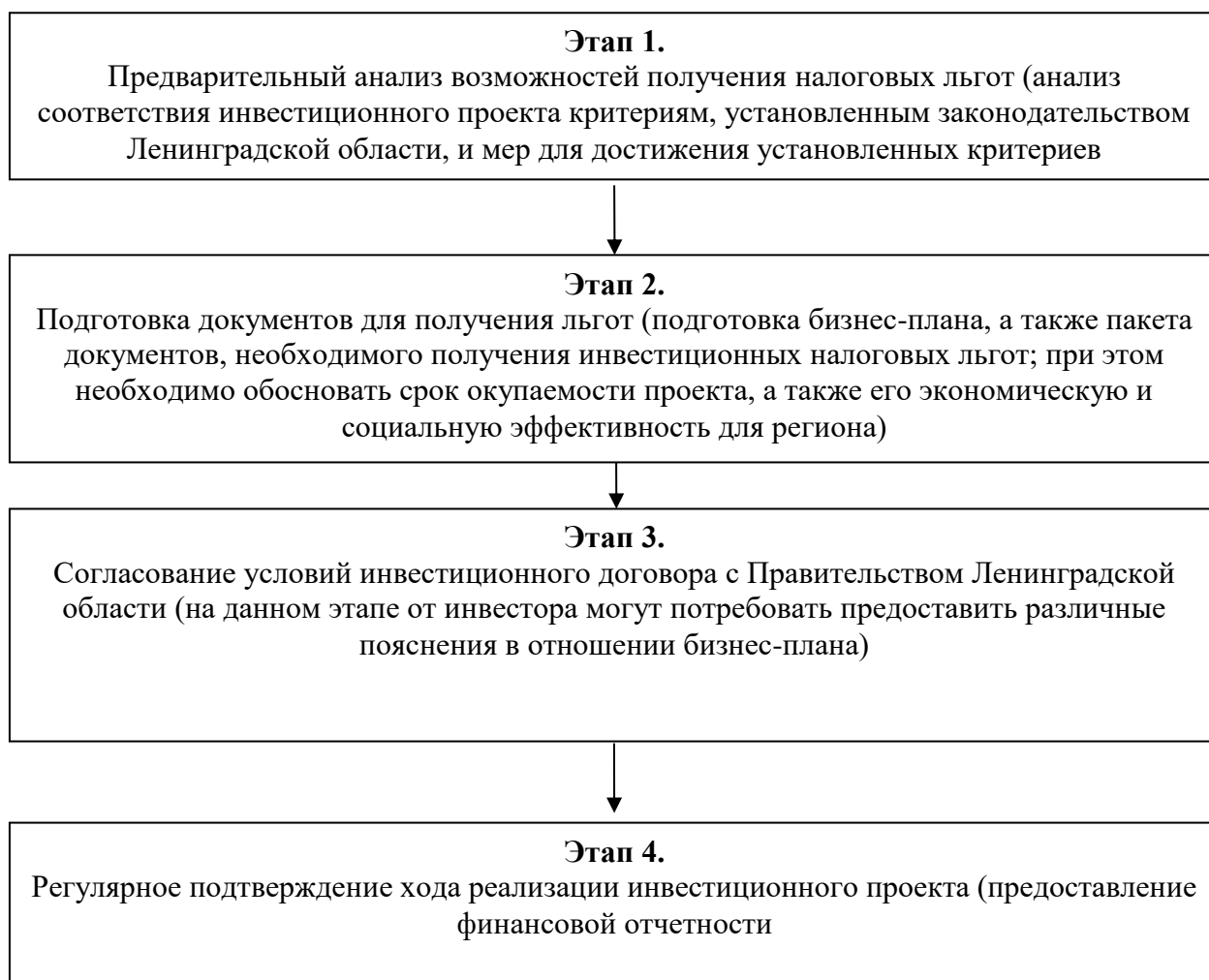
Рис. 2 – Основные этапы получения и применения инвестиционных налоговых льгот

Необходимо отметить, что в соответствии со ст. 1 113-ОЗ указанные в таблице 1 льготы предоставляются, если не менее 70 % выручки инвестора получено от вида деятельности, по которым предусмотрены налоговые льготы.