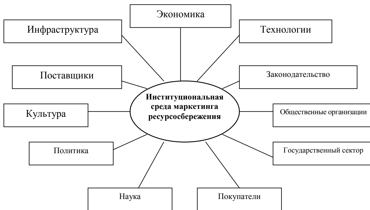
Рис. 1 – Институциональная среда маркетинга ресурсосбережения

Современные немногочисленные исследования вопросов ресурсосбережения с помощью маркетингового инструментария практически не затрагивают институциональных аспектов данной проблемы. Рассмотрение отдельных аспектов, связанных с оценкой объемов потребления сырья и материалов, целесообразностью инвестиций в ресурсосбережение и формированием экологического и ресурсосберегающего самосознания, лишь фрагментарно отражают суть проблемы. Имеющиеся достижения в области использования институционального подхода к организации взаимодействия государства, бизнеса и общества позволили предложить варианты ресурсосберегающего взаимодействия структур в рамках государственно-частного партнерства. Выделяется такие варианты взаимодействия: финансовое, материальное, административное. В первом случае приоритетная роль отведена финансированию проектов ресурсосбережения на долевой основе. Во втором случае государство применяет не финансовое, а материальное участие в решение вопросов ресурсосбережения. Третий вариант взаимодействия базируется на администрировании государством