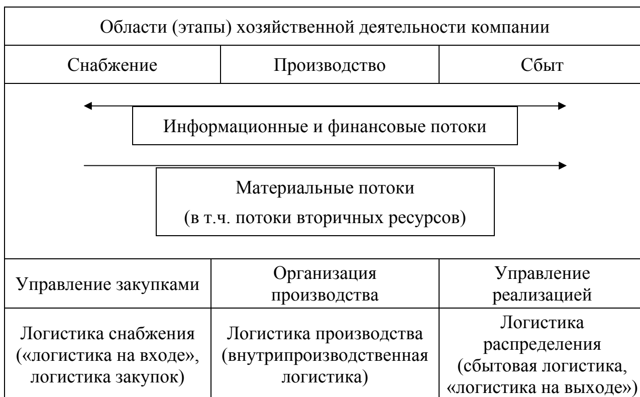
Рис. 1 – Функциональные направления логистизации бизнес-процессов

Нужно отметить, что материальный поток, включающий поток вторресурсов и неликвидов, опосредуется не только информационными и финансовыми потоками. Через каналы товародвижения проходит поток собственности и поток риска. Нельзя забывать и о кадровом обеспечении, сопряженных инновационных процессах и т.д.