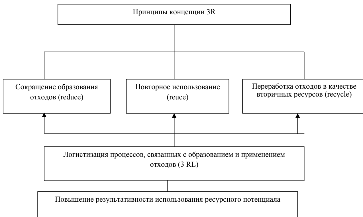
Рис. 2 – Задачи управления отходами производства по концепции 3R и их развитие с учетом возможностей логистики (3RL)

Очевидно, в научно-практический терминологический аппарат, следует ввести специальное понятие «логистика отходов» с подразделением его на «логистику отходообразования» и «логистику отходопотребления». В последствии, безусловно, потребуются детализированная проработка этих категорий, но само уточнение постановки проблемы уже приблизит ее решение.