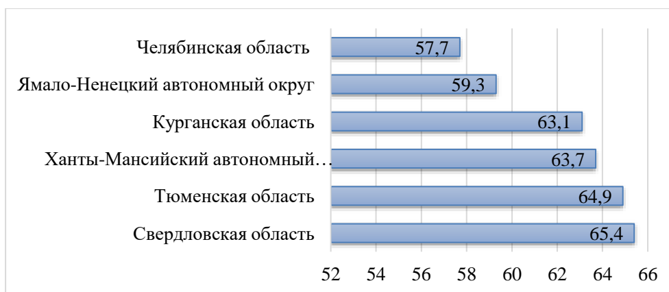
Рис. 3 – Удельный вес численности трудоустроенных выпускников системы среднего профессионального образования в Уральском федеральном округе, в %

57,7% [21]. Например, в Уральском федеральном округе по данному показателю Челябинская область имеет наименьшее значение (рис. 3).