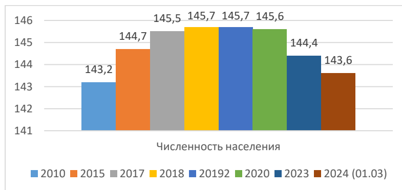
Рис. 1 – Динамика численности населения в России, 2010 – 2024 (январь, февраль) годы, млн. чел.

Текущее население России в апреле 2024 года составляет 144 045 522 – рис. 1 [31].