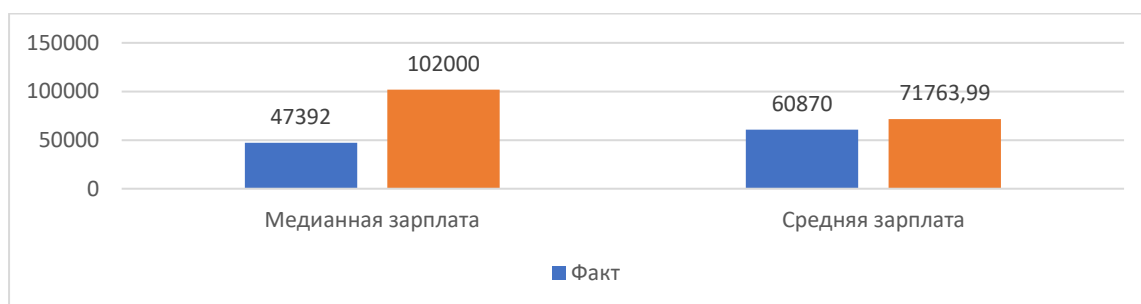
Рис. 2 – Зарплата в России, руб.

Зарботная плата по России. Медианная заработная плата в вакансиях: в России – 47 тыс. рублей. Средняя заработная плата в вакансиях: 60870 руб. Средняя зарплата сопоставима с медианной.