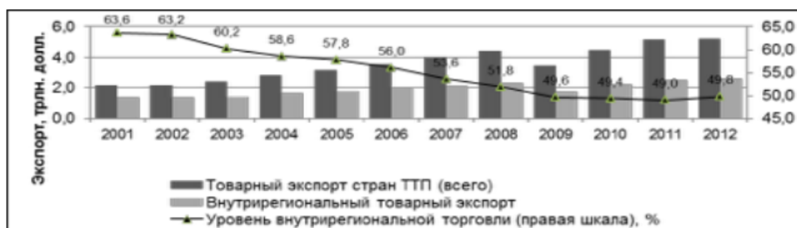
Рис. 4 – Динамика внутрирегиональной торговли товарами (экспорта) стран ТТП

Примечание. Источник: составлено автором на основе данных ЮНКТАД 2016 [Электронный ресурс]. URL: http://unctad.org (дата обращения: 01.03.2016)