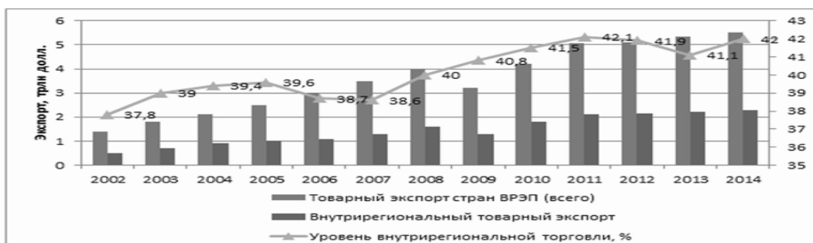
Рис. 3 – Динамика внутрирегиональной торговли товарами (экспорта) стран ВРЭП

Примечание. Источник: составлено автором на основе данных ЮНКТАД 2016 [Электронный ресурс]. URL: http://unctad.org (дата обращения: 01.03.2016)