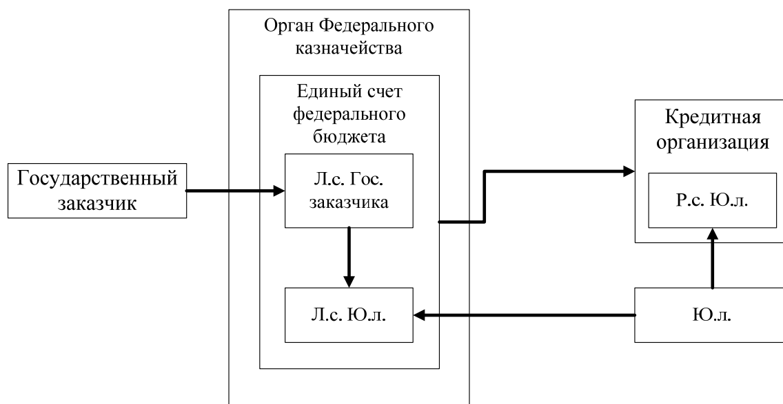
Рис. 2 – Схема казначейского сопровождения

Схематично процедуру казначейского сопровождения при санкционировании расходов юридических лиц можно представить на рисунке 2.