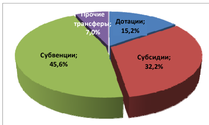
Рис. 2 – Структура межбюджетных трансфертов в 2013 г.

Всем известно, что финансовая самостоятельность муниципальных образований резко ограничена размерами финансовой помощи из бюджетов вышестоящего уровня (т.е. межбюджетных трансфертов), которые составляют львиную долю в доходах местных бюджетов. Согласно официальным данным, в 2013 году доля межбюджетных трансфертов составляет 61,1% от общего объема доходов местных бюджетов. Межбюджетные трансферты, связанные с финансовым обеспечением реализации собственных полномочий органов местного самоуправления по решению вопросов местного значения, в 2013 году составили 54,4% от общего объема межбюджетных трансфертов и 46,1% от объема собственных доходов местных бюджетов [4] (структура межбюджетных трансфертов местным бюджетам за 2013 год представлена на рис. 2). В связи с этим финансовое положение муниципальных образований находится в прямой зависимости от финансовых возможностей субъектов Российской Федерации, размеров межбюджетных трансфертов и налоговых доходов, передаваемых из бюджетов субъектов федерации местным бюджетам, а также эффективности механизмов их перераспределения между муниципальными образованиями.