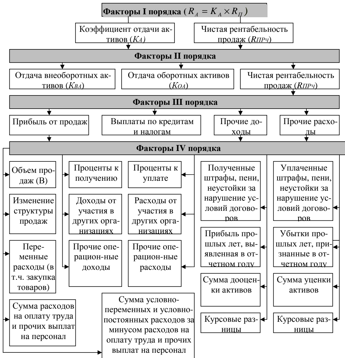
Рис.2 Факторы, влияющие на рентабельность активов ООТ

3.1) методом цепных подстановок за счет изменения себестоимости проданной продукции, расходов на оплату труда, прочих коммерческих и общехозяйственных расходов, процентов по кредитам, налогов, прочих доходов и расходов с учетом выручки от продаж: