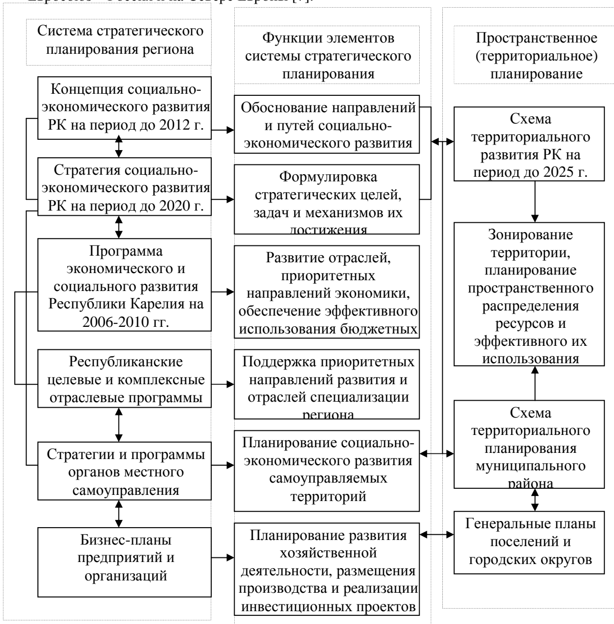
Рис.2. Пространственное планирование в системе стратегического планирования Республики Карелия

пространственную организацию, но и учитывать внешние связи и процессы, влияющие на социально-экономическое развитие. В связи с этим обстоятельством, как в Стратегии, так и в Схеме территориального развития РК рассматривается влияние внешней среды на развитие республики: влияние других регионов СЗФО, крупных городских агломераций г.Москвы и Санкт-Петербурга, а также, в силу приграничного положения, геостратегические интересы западных стран. Приграничное положение Республики Карелия позволяет принимать участие в различных совместных с западными странами проектах и программах. Одной из таких сфер взаимодействия является реализация совместных проектов пространственного планирования. Данное направление может рассматриваться как ключевое на пути построения единого экономического пространства Евросоюз – Россия и на Севере Европы [7].