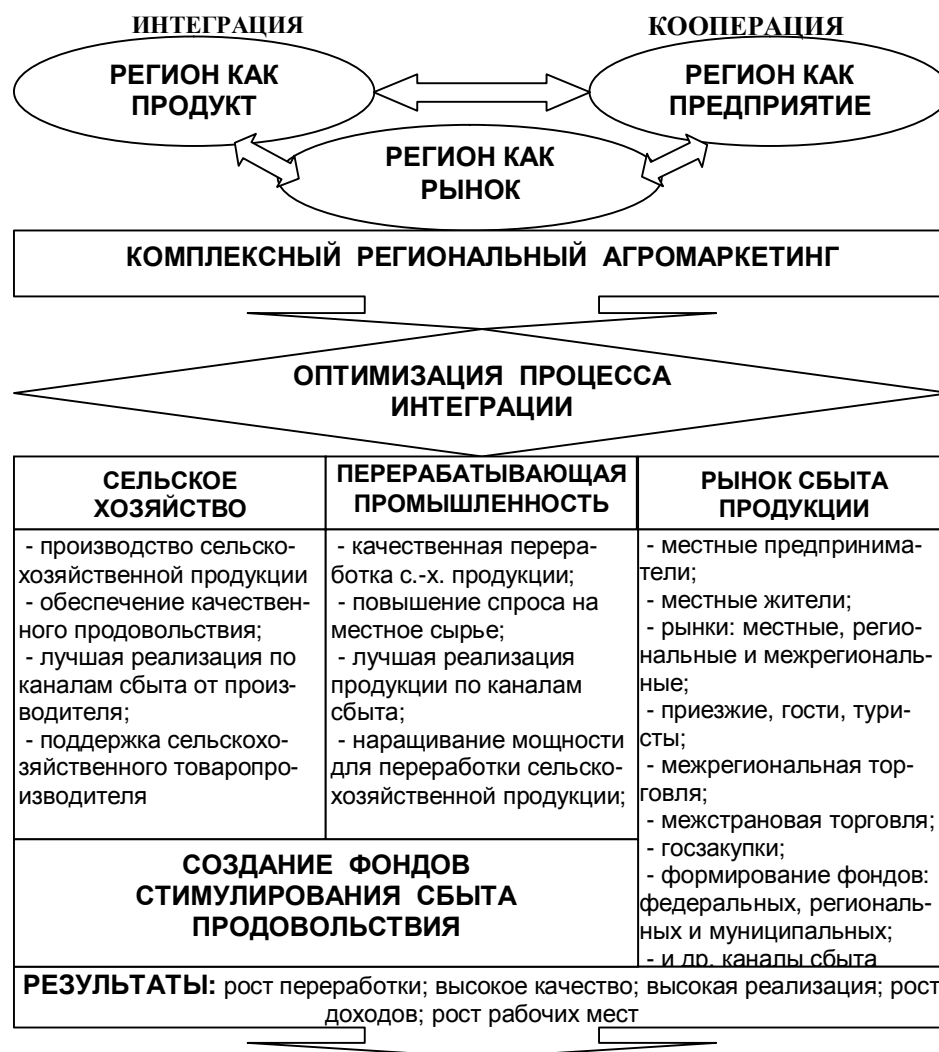
Рисунок 1 – Модель комплексного регионального агромаркетинга

Применением данной модели будут сохранены существующие и открыты новые рабочие места, при этом предполагается увеличение доходов местного населения; снижение нагрузки на окружающую среду в результате сокращения транспортных и производственных путей, более рационального использования природных ресурсов территории; уменьшение транзакционных издержек, создание добавленной стоимости и увеличение объемов сбыта региональной продукции; ведущих к повышению эффективности деятельности местных предприятий и т.д.