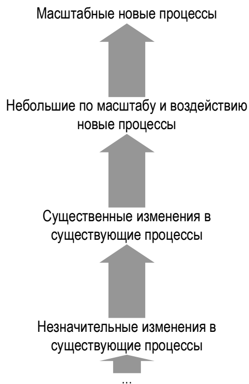
Рисунок 1. Континуальная модель инноваций М.Морриса и Д.Куратко

Как видно из рисунка 1, М.Моррис и Д.Куратко предлагают выделение определенных спектров или измерений феномена инноваций. Внутри каждого измерения можно выделять определенные виды, такие как расширение продуктового ассортимента, разработка новой для компании продукции и прочее. Но данные виды выделяются достаточно условно, и отличие одного вида от другого носит нечеткий характер.