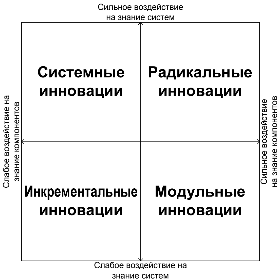
Рисунок 3. Классификационная модель инноваций Хендерсона-Кларка

Инкрементальные инновации обычно возникают на основе небольших модификаций знаний и о компонентах и о системах (или архитектуре). Если рассмотреть в качестве примера технологичной продукции жесткий диск для персонального компьютера, то в качестве инкрементальных инноваций можно признать последовательное увеличение емкости диска (на первых персональных компьютерах жесткий диск, как устройство постоянной памяти, мог вместить в себя 5 мегабайт, то современные жесткие диски вмещают терабайты информации 1 ) и увеличение скорости считывания информации.