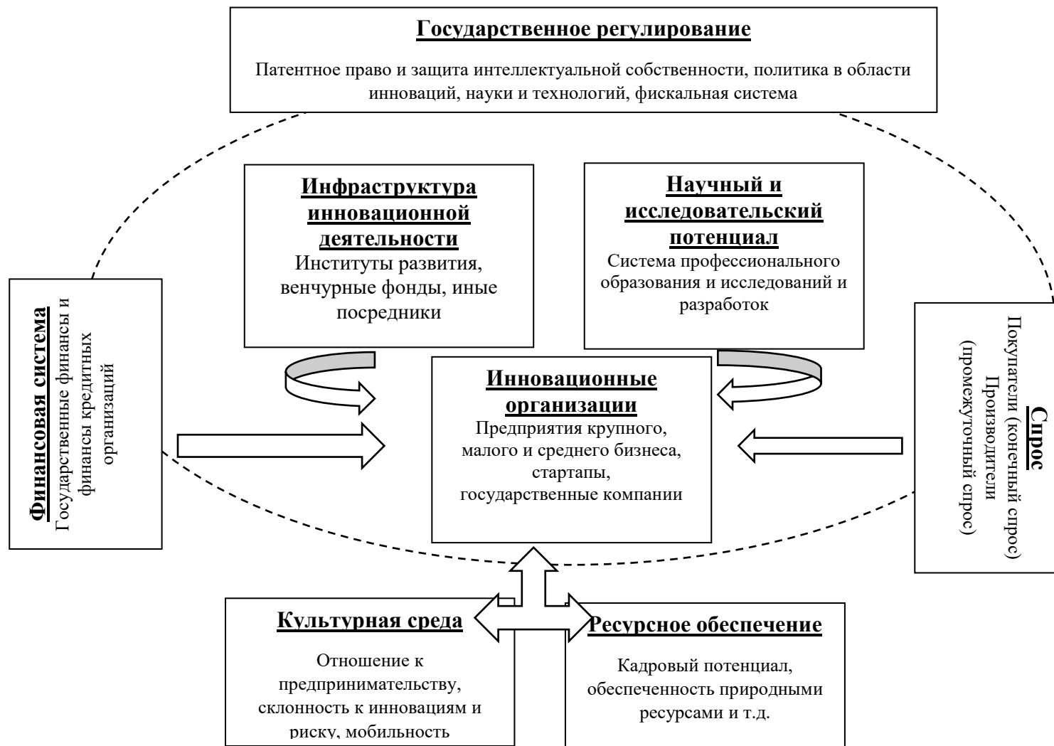
Рис. 1 – Роль государственного регулирования в обеспечении инновационного развития