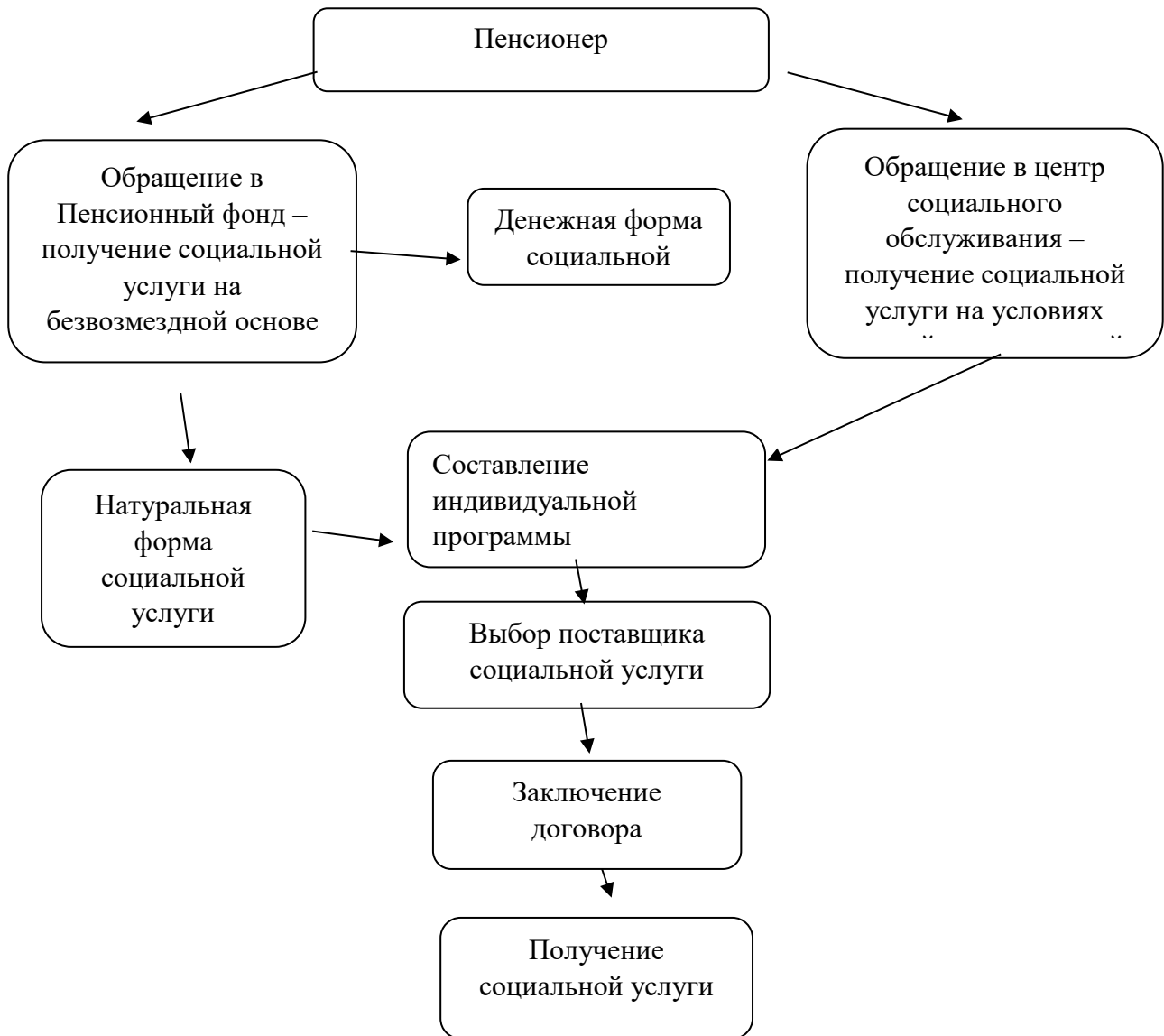
Рис. 2 – Процедура получения социальной услуги пенсионером *

на платной или частично платной основе, указываются все социальные услуги, стоимость каждой услуги, предоставляемой за полную или частичную плату, итоговая сумма социальных услуг. Процедура организации оказания социальных услуг пенсионерам представлена на рисунке 2.