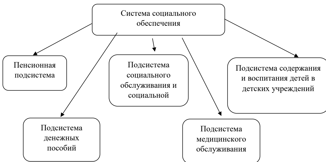
Рис. 1 – Структура системы социального обеспечения в РФ

комфортности их жизнедеятельности 1 . Достижение установленного уровня социальной защищенности граждан достигается с помощью предоставления услуг по социальному обеспечению, направленных на создание системы поддержки жизненных потребностей населения. Система государственного социального обеспечения имеет разветвленную структуру и представлена на рисунке 1.