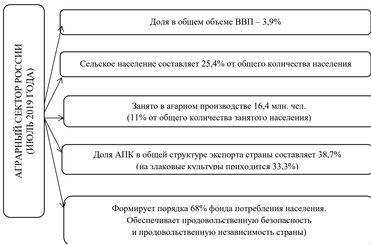
Рис. 1 – Аграрный сектор в экономике России (на 01.07.2019 г.) [7]

Кроме того, целевое финансирование аграрного сектора экономики является недостаточным из-за незначительных объемов бюджетных средств на поддержку развития отрасли и несбалансированности бюджетов.