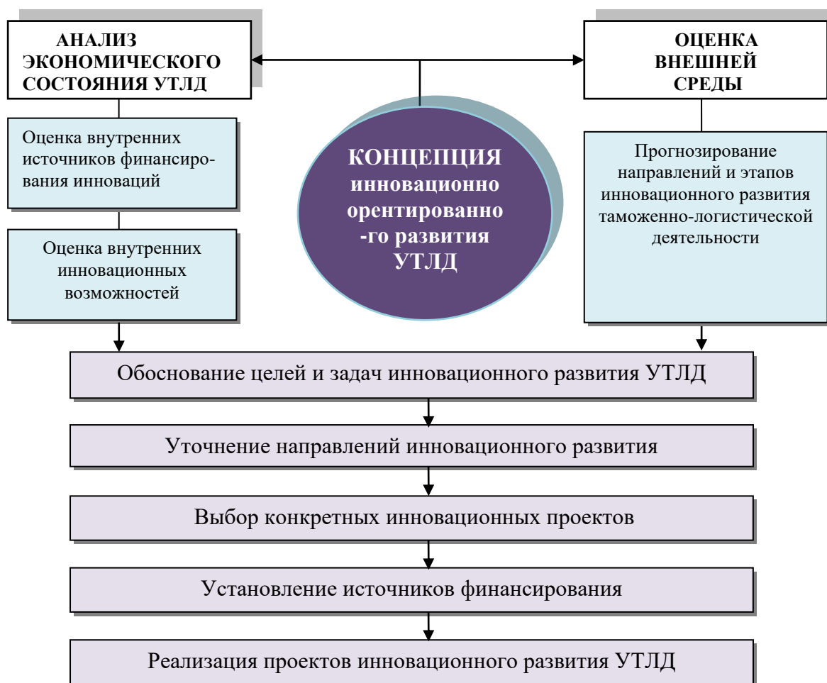
Рис. 2 – Модель инновационного развития УТЛД

Модель, инновационного развития УТЛД приведена на рис. 2.