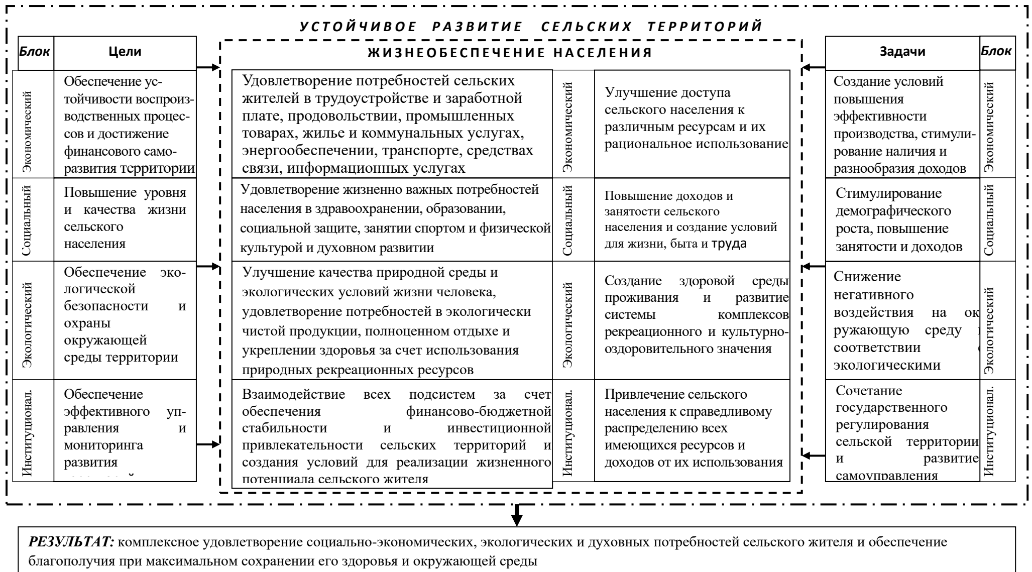
Рис. 1 – Место жизнеобеспечения населения в системе устойчивого развития сельских территорий