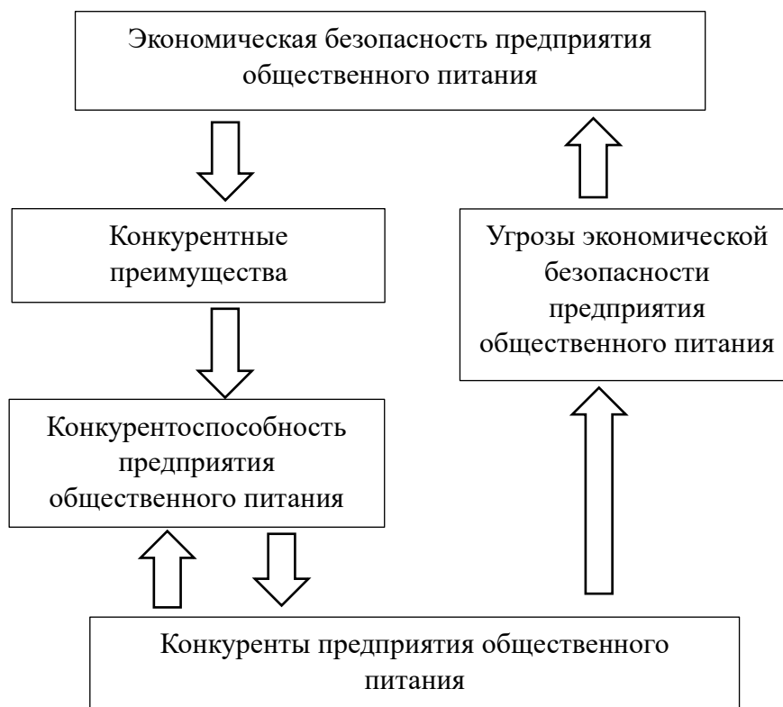
Рис. 3 – Взаимосвязь конкурентоспособности предприятия и экономической безопасности

Взаимосвязь конкурентоспособности предприятия общественного питания с экономической безопасностью можно рассматривать следующим образом: (см. рис. 3) [4]