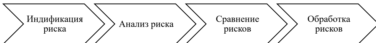
Рис. 2 – Мониторинг и процесс оценки рисков на предприятии

Система мониторинга экономической безопасности направлена на оценку рисков, которые могут возникнуть на предприятии в процессе осуществления своего вида деятельности. (см. рис. 2)