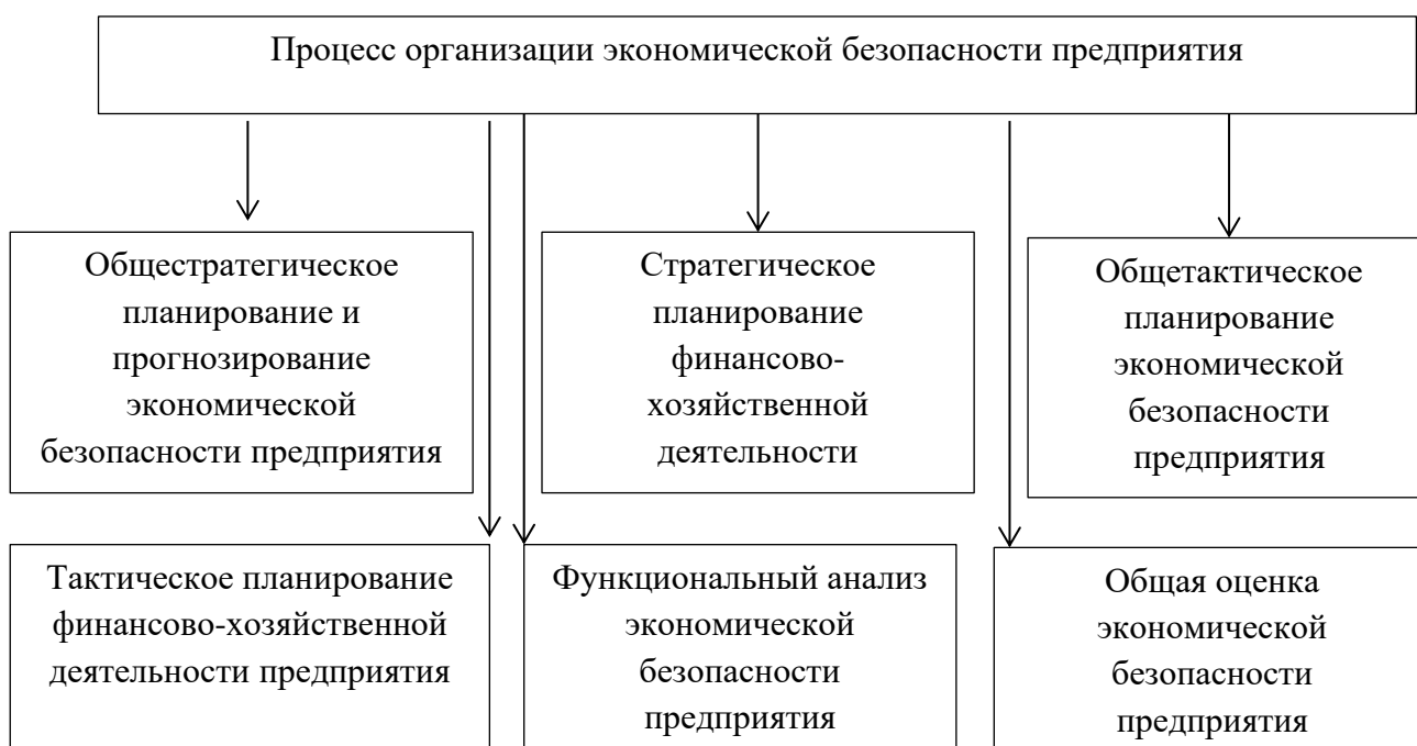
Рис. 1 – Процесс организации экономической безопасности предприятия

Также стоит уделить внимание процессу организации экономической безопасности хозяйствующего субъекта, данный процесс включает в себя осуществление функциональных компонентов, способствующих нивелировать вероятность получения вреда и поддержание наиболее низкого уровня негативных угроз от его воздействия в будущем периоде и отразим его в виде схемы (рис. 1).