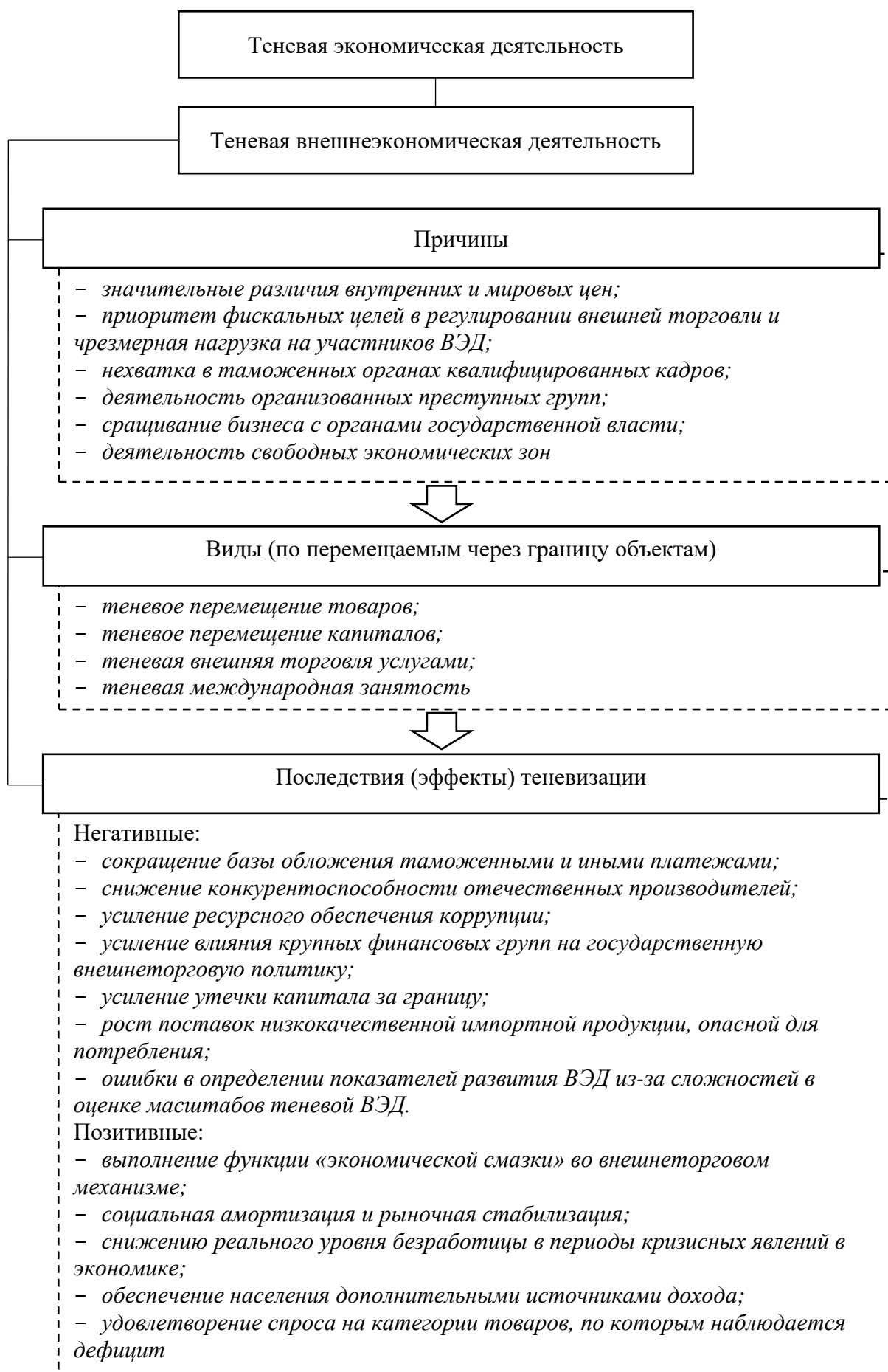
Рис. 1 – Причины, виды и последствия теневой ВЭД в России