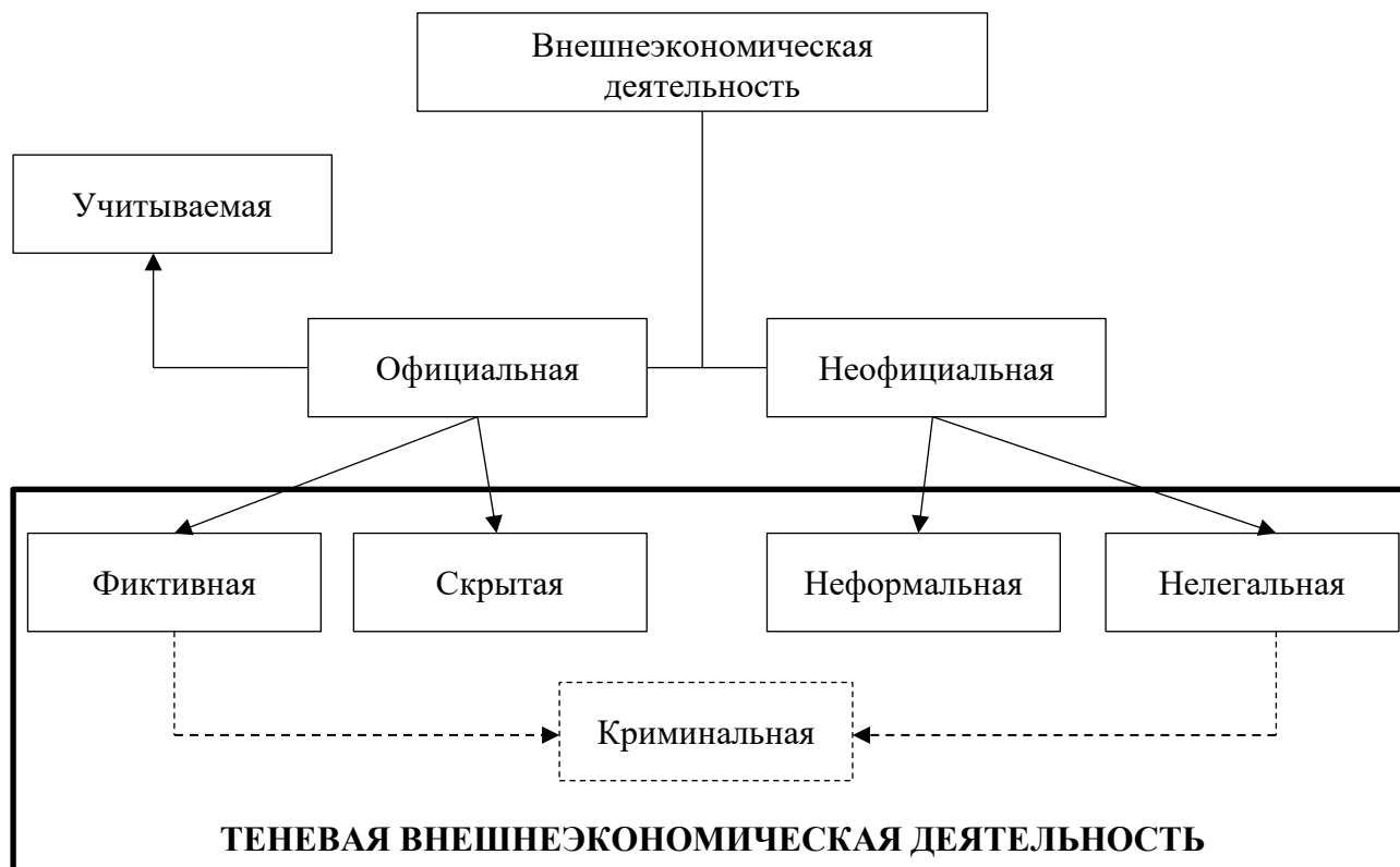
Рис. 2 – Формы теневой внешнеторговой деятельности

потребления, а также деятельность организаций с незакрепленными юридически отношениями между партнерами, в которых занятость работников формально не оформляется. Соответственно, неформальная внешнеторговая деятельность включает челночную деятельность, деятельность туристов- «помогаек».